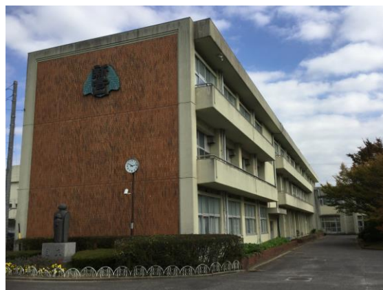
会場：愛知県岡崎市立新香山中学校