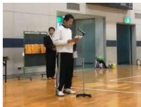
松下副理事長 開会宣言