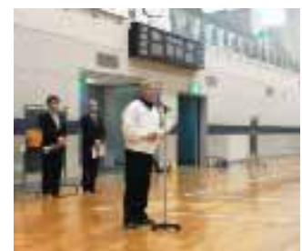
榎田審判長 審判注意説明