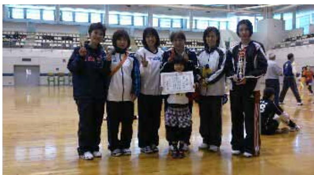
生き生き部 優勝 嵯峨野