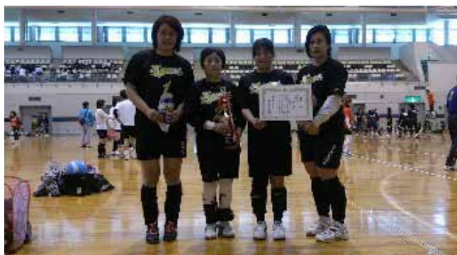
生き生き部 優勝 カメックス