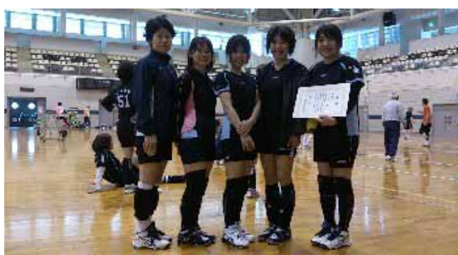
準優勝 マザーグース