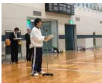
中川競技委員長 競技説明